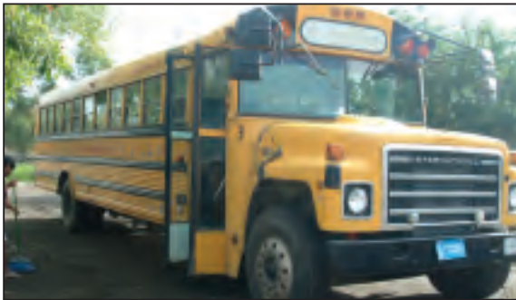
Camión de escuela donado a Proyecto Amigo, A.C. en Colima, México